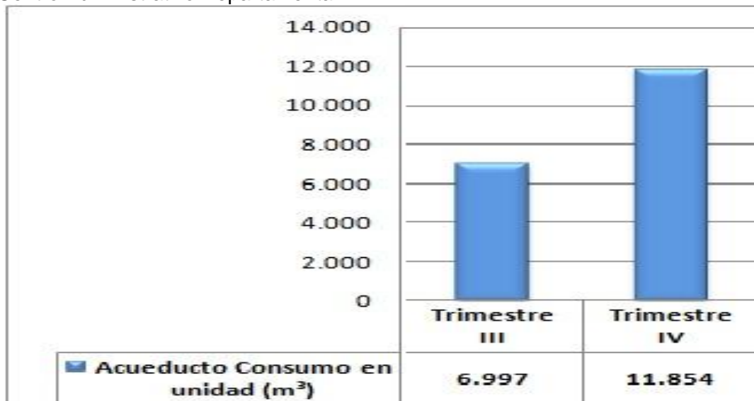
Gráfica 2: Servicios Públicos - comparativo Acueducto trimestral

Al realizar el comparativo del tercer trimestre de 2018 y cuarto trimestre de 2018 se presentó un aumento del 69.41%, sobre consumo de acueducto (m 3 ) en el Centro Administrativo Departamental.