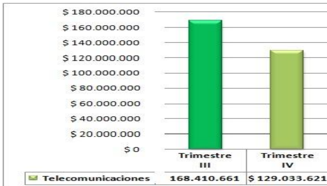
Gráfica 3: Servicios Públicos – Telecomunicaciones comparativo trimestral

Al realizar el comparativo del tercer trimestre de 2018 y cuarto trimestre de la vigencia 2018 se presentó una disminución en telecomunicaciones del 23.38% en el Centro Administrativo Departamental debido a que la Secretaría de Educación por encontrarse las Instituciones Educativas en vacaciones no demandó servicios en llamadas telefónicas. Tal como se observa en la gráfica N° 3.